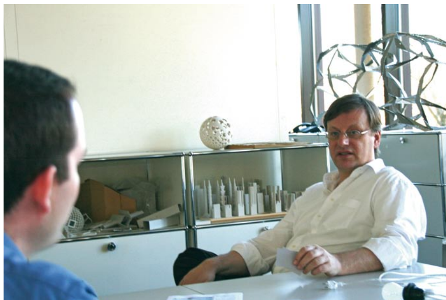
Bild 1 «Digitalstrom muss einfach sein, es soll die Raumautomation massenfähig machen.»

Aus welchem Bereich kommen diese Partner?