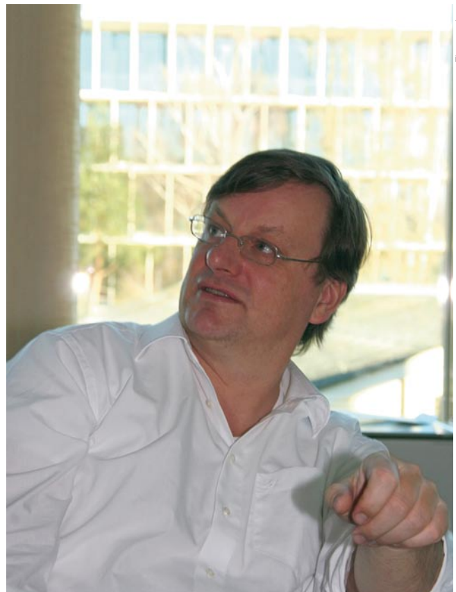
Bild 3 «Für Installateure wird es einfacher, sie ordnen die Lampen erst zu, wenn die Wohnung fertig ist.»

Der Chip misst nicht sehr genau. Zudem können wir diesen Stromverbrauch nicht ständig kommunizieren, da fehlt uns die Bandbreite. Der Chip misst grob vor Ort und kommuniziert Stromänderungen. Der Digitalstrom-Meter (DSM), der Schütz im Sicherungskasten, misst den Strom präzise und ordnet die Sprünge den einzelnen Geräten zu. Also: Eine Lampe meldet «Ich brauch jetzt mehr Strom», und der Meter, der